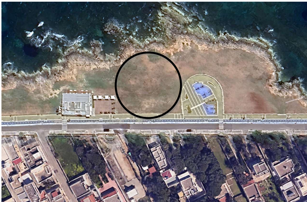
STRALCIO ORTOFOTO "1"